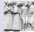
CASA DI CURA "MADRE FORTUNATA TONIOLO"

Le richieste di attivazione di un CENTRO ME-STOP "Satellite" devono essere inviate alla Segreteria Organizzativa H.T. Congressi srl all'indirizzo e-mail: centromestop@virgilio.it www.mestop.com